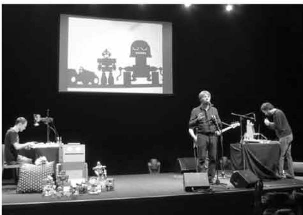
salle 400 places écran haut / VP plafond VP et connectique (éventuellement caméra) gérée par la salle Le pas de vis sur le pied caméra est standard boîtier de conversion vidéo/VGA possible

Dans un configuration minimum, adaptée à des plus petites salles, le groupe amène une grande partie du matériel de scène (éléments de décor, pied de caméra, caméra, écran, VP...); mais reste à fournir : 2 tables 1 ou 2 chaise(s) bloc ou table type bar ou cube... pour poser des éléments sur scène alimentation électrique (blocs rallonges, blocs prises...)