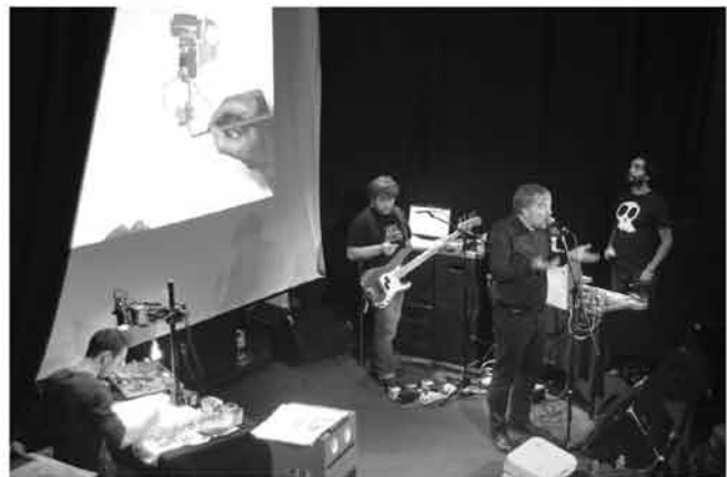
petite scène / salle 200 places écran haut / VP au sol sur scène matériel vidéo géré par le groupe